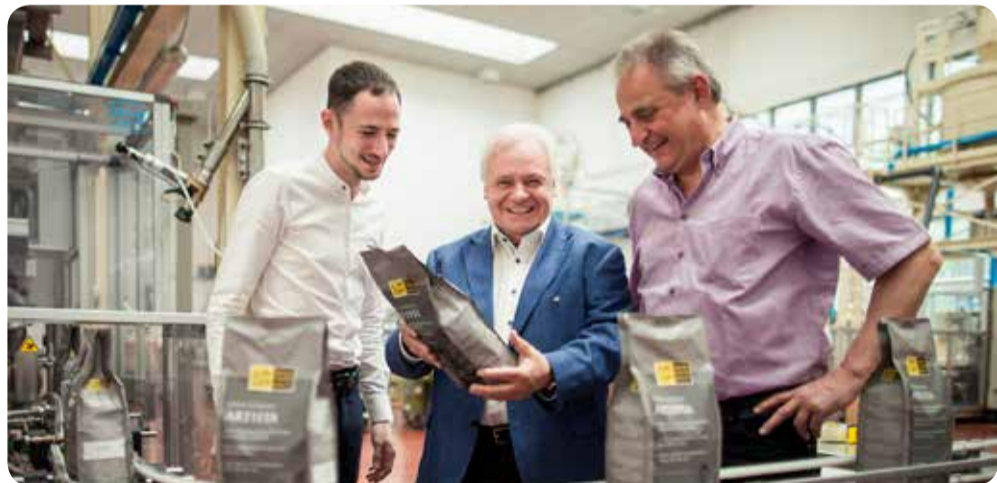
„Wenn man eine Leidenschaft miteinander teilt, kann etwas Großartiges entstehen.“

Wer eine solche Schaffenskraft in sich trägt wie Eckart Witzigmann, hört im Alter nicht einfach auf, Ideen zu produzieren.